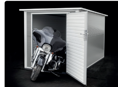
RAL 9006 Weiß Aluminium