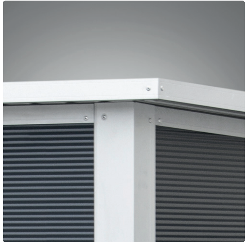
Variante mit Eckpfeiler