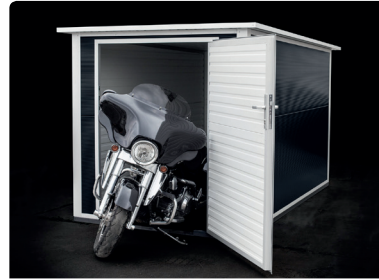
RAL 7016 Anthrazitgrau